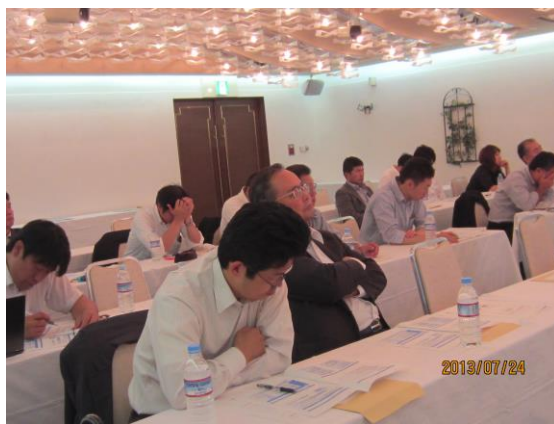
ロシアビジネスセミナー in 宮城