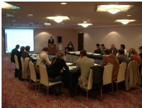
サハリン州でのプレゼンテーション