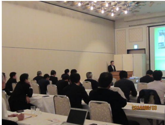
ロシアビジネスセミナー in 石巻 -サハリン訪問等を踏まえて-